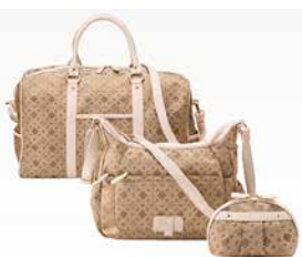
ボストン 3点セット CR20250 ¥25,000

BK 4582210209887 GO 4582210209894 PI 4582210209900 包装サイズ（袋）：49×50×17cm 1275g 5入