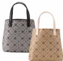
ブラック&ゴールド (BG)