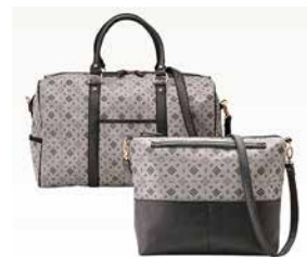
ボストン&2WAYショルダー CR15200 ¥20,000

BK 4582210209856 GO 4582210209863 PI 4582210209870 包装サイズ（袋）：49×50×13cm 955g 8入