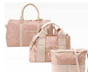
ボストン&ショルダー 2点 CR25300 ¥30,000

BK 4582210209917 GO 4582210209924 PI 4582210209931 包装サイズ（袋）：49×50×20cm 1575g 4入 ※ボストン×1 ショルダートートバッグ×1 ポーチ×1