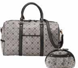
ボストン & ポーチ CR15150 ¥15,000

BK 4582210210135 GO 4582210210142 PI 4582210210159 包装サイズ（袋）：24×26.5×11cm 200g 20入