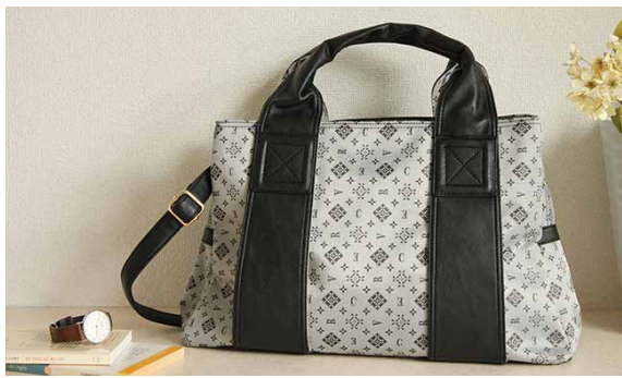
ショルダートートバッグ ¥12,000