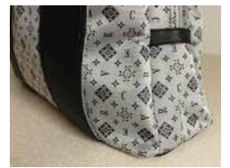
ショルダートートバッグ CR10012

H28×W45×D14cm 持ち手高さ約 15cm ショルダーベルト付 ショルダー長さ約 72～126cm 素材：ポリエステルジャガード、合成皮革 両アオリポケット（内側＝オープンポケット×各2） 内側＝オープンポケット×2、ファスナーポケット×1、 ペットボトルホルダー×1 開閉＝ダブルファスナー式、マグネット式（両アオリポケット） BK 4582210209795 GO 4582210209801 PI 4582210209818 包装サイズ（袋）：40×42×3cm 980g 8入