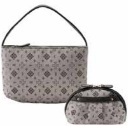
バックインポーチ&ポーチ CR30070 ¥7,000

重さ約 880g の軽量 バッグ。大きく開く ダブルファスナー＆安 心の底紙付。