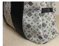
ショルダートートバッグ CR10012

H28×W45×D14cm 持ち手高さ約 15cm ショルダーベルト付 ショルダー長さ約 72～126cm 素材：ポリエステルジャガード、合成皮革 両アオリポケット（内側＝オープンポケット×各2） 内側＝オープンポケット×2、ファスナーポケット×1、 ペットボトルホルダー×1 開閉＝ダブルファスナー式、マグネット式（両アオリポケット） BK 4582210209795 GO 4582210209801 PI 4582210209818 包装サイズ（袋）：40×42×3cm 980g 8入