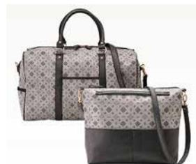
ボストン&2WAYショルダー CR15200 ¥20,000

BK 4582210209856 GO 4582210209863 PI 4582210209870 包装サイズ（袋）：49×50×13cm 955g 8入